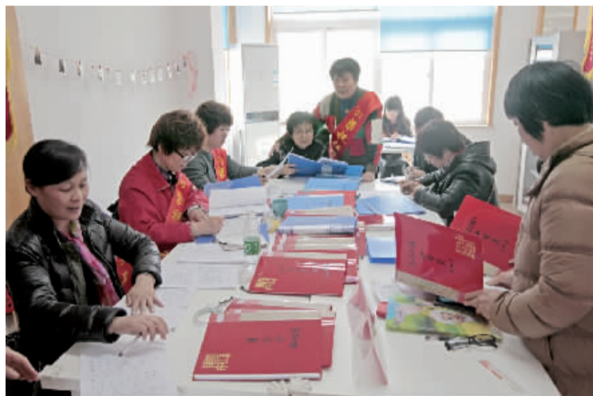
公益红娘整理相亲者资料。