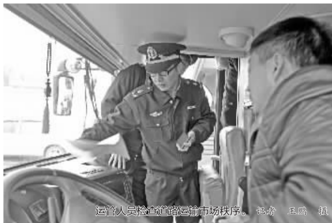
运管人员检查道路运输市场秩序。