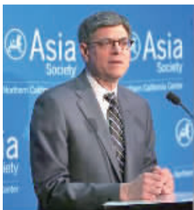
当地时间3月31日，旧金山，美国财政部长雅各布·卢就中美经济关系发表讲话。

美国财政部长雅各布·卢3月31日说，人民币仍未准备好进入国际货币基金组织（IMF）特别提款权（SDR）货币篮子。