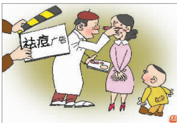
——为啥先在脸上画痘痕