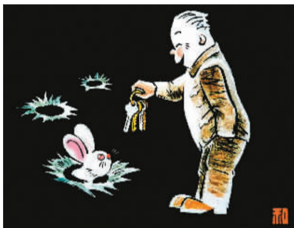
你只有三窟，我占了四套