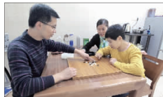
空闲时，父母陪小波下五子棋。