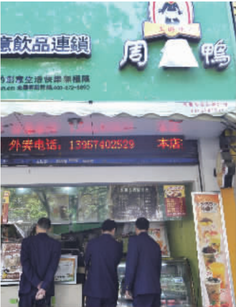
昨天，执法人员在海曙粮丰街一家冒名“周黑鸭”店检查，店主已将商标中的“黑”字挡住。

鸭”三个字已经被老板用白布遮掉了“黑”字，店里卖的卤味品种很多，鸭脖、鸭舌、鸭翅、藕片、海带各色卤水制品。价目表上，印着“周黑鸭”和注册商标男童类似的图标。老板的母亲平日帮忙料理这家小店，她说