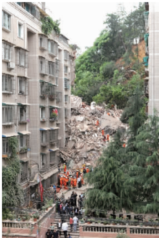
垮塌事故现场。

20日上午11点29分，贵州省贵阳市一栋9层居民楼垮塌。经初步核查，垮塌房屋共有住户35户114人。截至20时，114人已全部排查，目前仍有16人未联系上。经勘测，有15人的手机信号在事故现场。据介绍，山体仍可能滑坡，周边4栋房屋的住户已全部疏散。