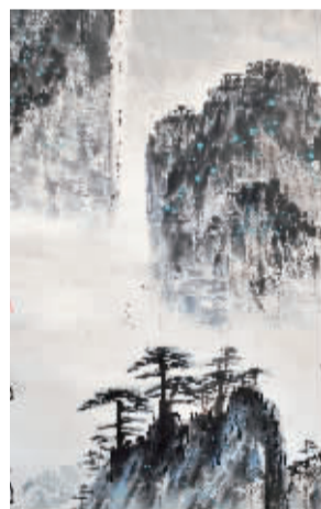
李宪润《步步登高图》 100cm×54cm