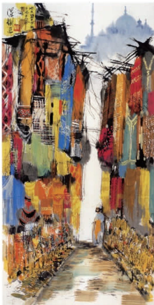
埃及开罗·哈里里多姿多彩的艺术市场 136cm×68cm