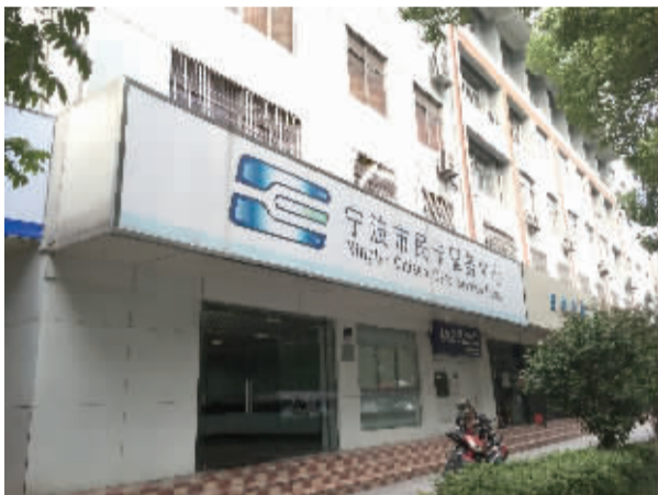
位于百丈路 149 号的甬城通 IC 卡服务中心。