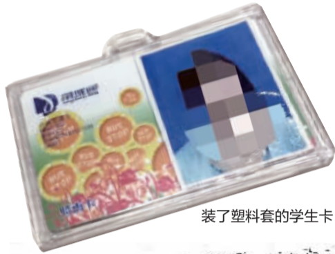
装了塑料套的学生卡。