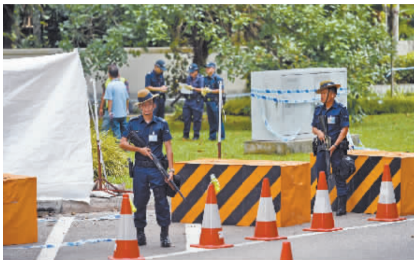
调查人员在枪击现场勘查。