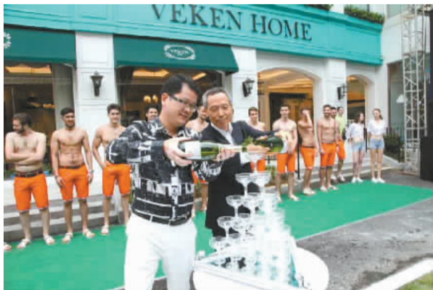
重新定位后的维科家居旗舰店在海曙区体育场路2号精彩亮相。

一直以来,维科在宁波人心目中是一个品质过硬,价格坚挺的家纺品牌。但这几年来,受到电商的冲击,家纺产业的线下实体店受到了巨大的冲击。在这种形势面前,维科家纺壮士断腕,决定转型。因此去年下半