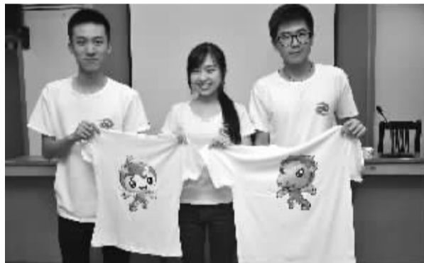
三位志愿者展示博览会志愿者服装。

男式T恤为白色，女式为粉红色。正面左胸口处印有首届中东欧博览会的会徽。男式T恤的背面印有吉祥物“驼娃”，象征着“丝绸之路经济带”和充满活力的中国形象；女式T恤的背面印有吉祥物“海娃”，体现“海上丝绸