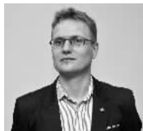
波兰形象代表卡罗。

志愿者服装只针对志愿者发放。据悉，组委会办公室自4月中旬起，公开向全社会招募志愿者。经层层遴选，已确定336名志愿者，其中大部分来自宁波高校。他们将参与中东欧博览会各项活动，承担翻译、解说、引导、接待、后勤等志愿服务工作。