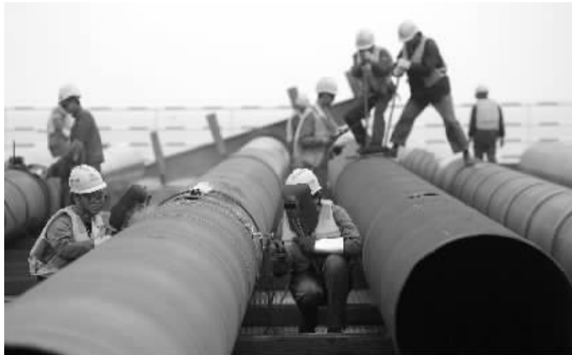
三门湾跨海大桥海上建设工地，工人们严格按照操作规程，连接40米长的钢管桩，为管桩做好防腐工作。

要按照《宁波市建筑施工工地扬尘控制管理（暂行）规定》要求，开展建筑工地扬尘综合整治，继续严格落实围挡设置、出场车辆冲洗等8个100%扬尘控制指标。建筑工地注意施工场地内部环境同时，还要做好工地周边的卫生保洁；要建立健全长效保洁机制，积极配合保洁单位做好工地周边20米范围内保持工作。