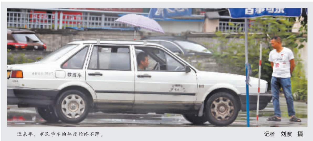
近年来,市民学车的热度始终不降。