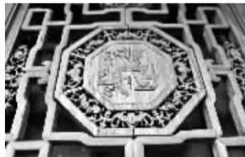
▲木窗棂上的精致雕花