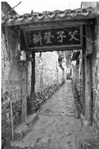
▲旗杆闾门内的“父子登科”匾额

明清时期，村中有大学士、将帅、进士、文武举人、秀才等十余名科举人才，在近现代也涌现出不少知名文化人士。