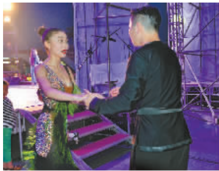
来自宁波文化艺术培训中心的拉丁舞者正在进行上台前的准备。