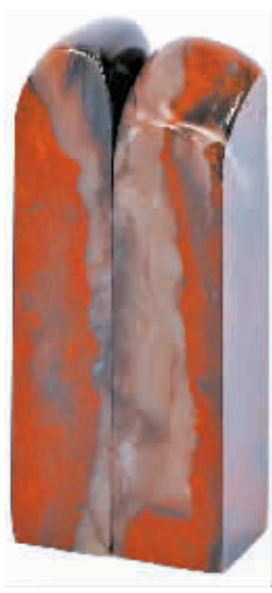
展览展出的大松石印章

有！宁波市鄞州区的大松石就是其中的一种。前天，“北纬30°的七彩传奇”——首届中国大松石展览在李元摄影艺术馆开幕。