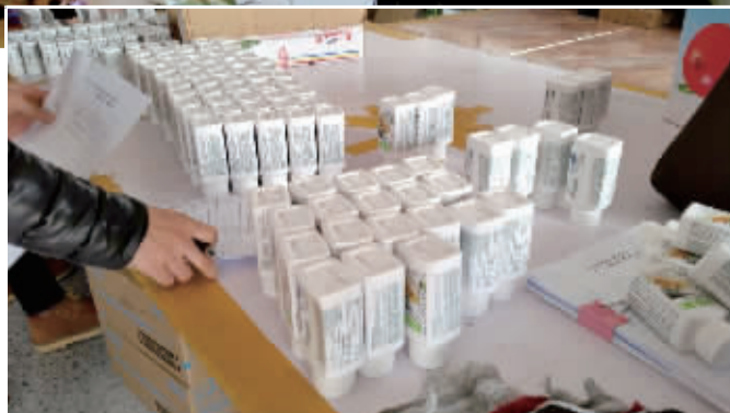
▶某网店违法销售的安利海外产品。