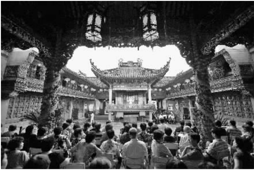
宁波小百花越剧团正在演出《花中君子》。