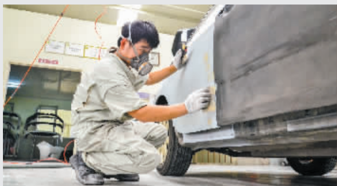
4S店工作人员对车辆进行维修。

汽车进入千家万户后,围绕汽车消费,机动车维修如今已是民生行业,关系到普通人民群众的切身利益。去年9月,交通运输部、国家发改委、公安部、教育部等十部委发布了《关于促进汽车维修业转型升级 提升服务质量的指导意见》(交运发[2014]186号),《意见》指出,近年来我国汽车维修业取得了长足发展,较好地适应了汽车产业和汽车社会发展、满足了广大消费者的汽车维修需求,但是也在一定程度上存在着市场结构不优、发展不规范,消费不透明、不诚信等问题。同时指出,未来5至10年,是我国全面建成小康社会的关键时期,汽车维修业将获得更为广阔的发展空间,也必将在服务人民群众平安、便捷、舒适汽车生活方面发挥更大作用。