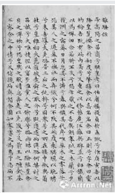
楷书楚辞精品册页 (文徵明)