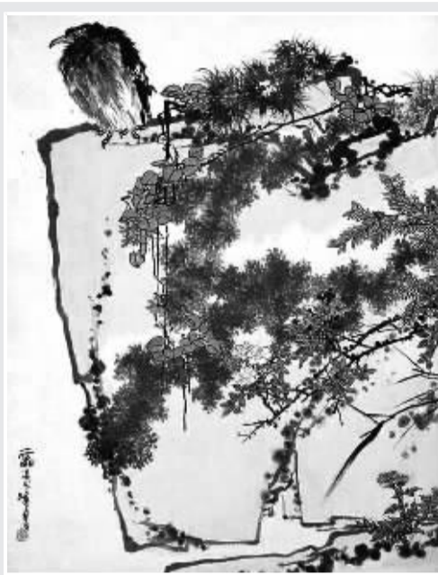
鹰石山花图 (潘天寿)