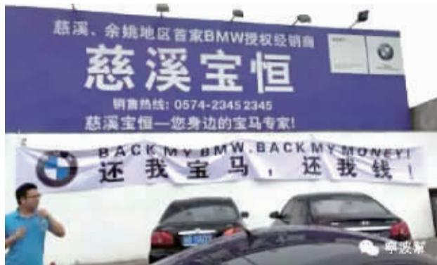
部分受害消费者在慈溪宝恒4S店前“讨债”。