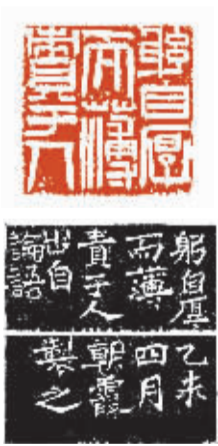
躬自厚而薄责于人 (白文连款)