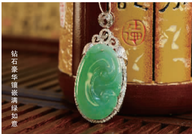
钻石豪华镶嵌满绿如意