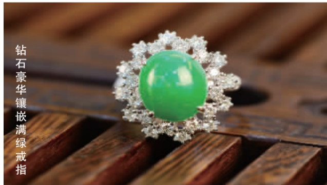
钻石豪华镶嵌满绿戒指