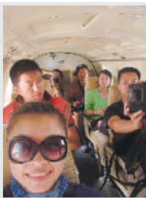
在尼泊尔坐小飞机终于落地