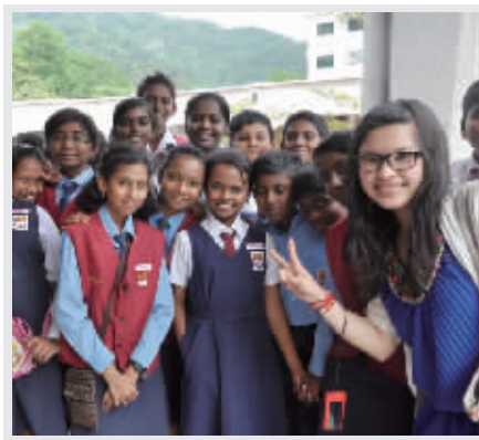
在马来西亚和当地孩子在一起