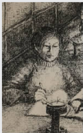
在油灯下学习（素描）