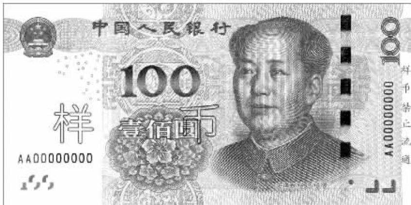
即将发行的新版100元纸币样币正面。