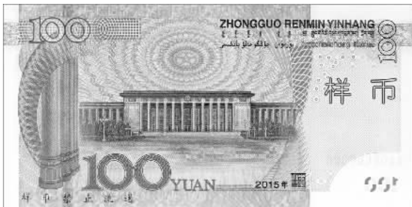
即将发行的新版100元纸币样币背面。