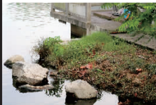
只剩下两个树桩 摄于2015年8月11日