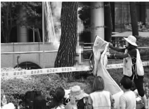
韩国男子自焚现场。

日本驻韩国使馆上一次遭遇自焚事件是在2005年。当时，一名54岁男子因抗议日本宣称对独岛（日本称“竹岛”）拥有主权而在日驻韩使馆前自焚。 据新华社