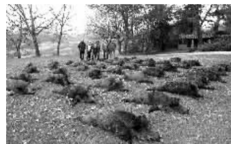
意大利猎杀野猪场景。

意大利一名老人日前在南部西西里岛遭遇野猪袭击身亡。日益壮大的野猪种群已经对人类活动产生威胁，引起意大利全国关注。