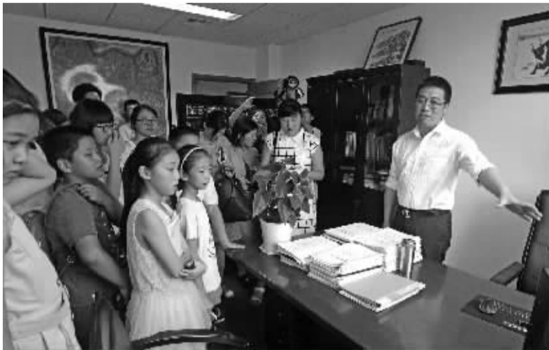
“小布丁”们在参观海曙区区长吴胜武的办公室。