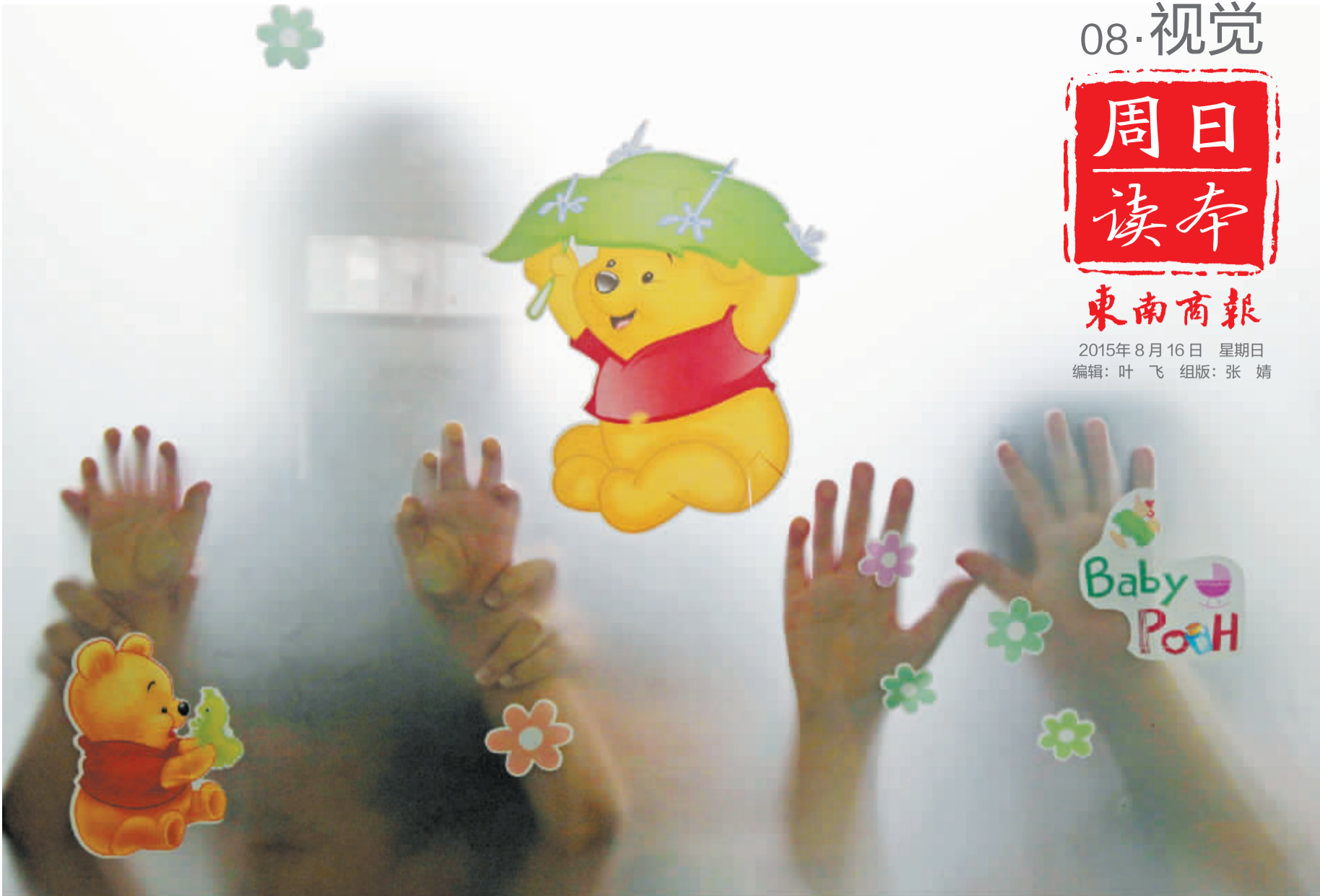
在“满天星”教室里，老师和孩子做游戏，培养他们交流的能力。