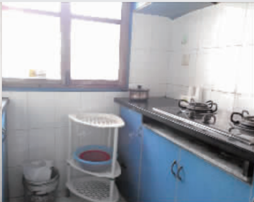
厨房里的灶台擦得干干净净。