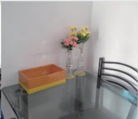
餐桌上摆放着两盆装饰花。