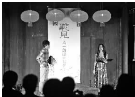
现场演出话剧《恋爱的犀牛》选段。