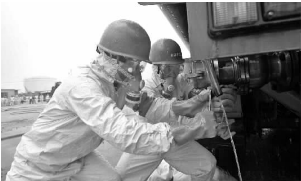
道路运输行业正在进行危化品运输安全应急演练。(资料图片)

经历两个月的持续低迷后,7月我市普货运输市场行情转暖,企业采购热情较为高涨,部分经营户反映,家电、纺织品的运输需求明显增多,且省外回程运输行情较好,同时7月我市举办的家具博览会有效拉动了运输需求。另外,7月部分省市由于暴雨、高温天气影响,导致道路运输成本增加。8月高温将持续,部分工厂将放高温假,再加上小家电等货物运输需求形势不明朗,普货运输价格指数走势有待进一步观察。