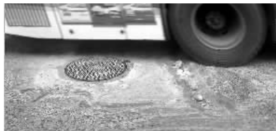
三眼桥南侧下桥处的坑洞经简单修补。

三眼桥头一家店铺主人告诉小e，四五天前，有人在现场修补过坑洞，这些人衣服上印有“市政”字样。修路的人当时说，以后要铺沥青，但不知道什么时候会来铺。