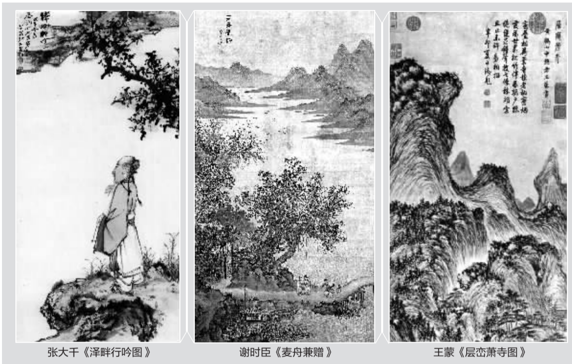
张大千《泽畔行吟图》