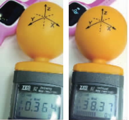
儿童电话手表待机(左图)、通话辐射