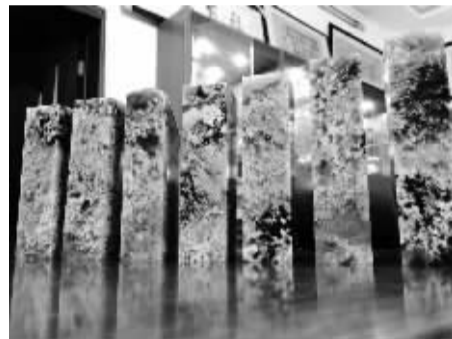
蛋花鱼籽冻系列印章