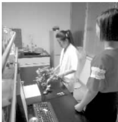
检测室工作人员正在为消费者检测蔬菜。

免费为公众检测果蔬 3000 余批次 同时主动开展针对性快速抽检 43186 批次