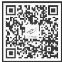
扫二维码看铁路宁波站全景图

目前,南站区域停车场一天进出车辆约为5000辆次,停车时间以半小时居多,24小时停车的只有1%多一点。但周末和节假日期间,该区域的停车位还是比较紧缺,因此,建议市民尽量不要长时间停放,而是多采用公共交通等方式进站。