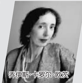
乔伊斯·卡罗尔·欧茨