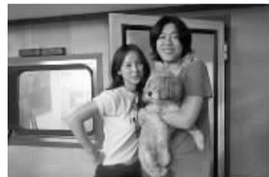
李孝利和老公李尚顺