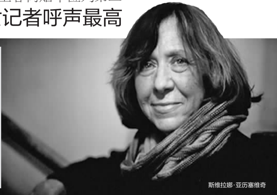
斯维拉娜·亚历塞维奇

2015年诺贝尔奖揭晓时间临近，据诺奖官方网站近日报道，生理学或医学奖揭晓时间为10月5日，6日揭晓物理学奖，7日揭晓化学奖，和平奖和经济学奖分别在9日和12日揭晓。我们最关心的文学奖呢？官网表示将稍后择日宣布。不过按照惯例，文学奖都在每年十月的第二个周四公布，也就是今年的10月8日。