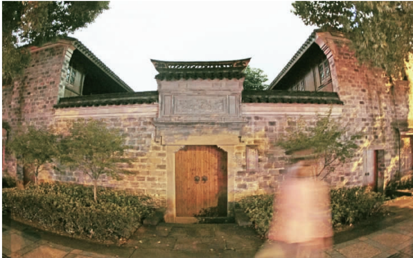
开明街26号,屠呦呦在宁波生活时就住在这里。

昨日,屠呦呦获奖的消息传到宁波,她的母校效实中学和宁波中学的师生们都欣喜至极。屠呦呦1948年春到1950年春在效实中学读高中,后来由于家庭经济原因,她从私立的效实中学转到公立的宁波中学。