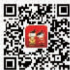
微博 @ 宁波福彩微活动