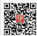
微信公众号“看福彩”

http://fc.zjol.com.cn http://nbfc.cnool.net 宁波市福彩中心地址:曙光路86号 电话:27669518 27663709 27663702