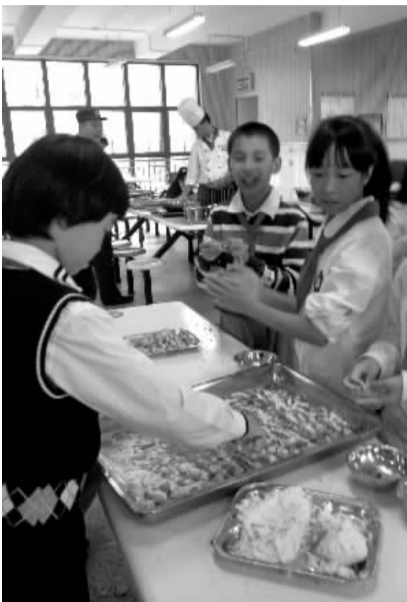
孩子们在做缤纷汤圆。

为教好这门课，任一波也花了不少心思。他说：“比如，在上汤圆课时，我查了很多资料，在实践操作的同时，还要告诉孩子们一些汤圆的历史知识和有关故事。还有粽子、月饼等，都是很有来历的，里面有着丰富的文化底蕴。”