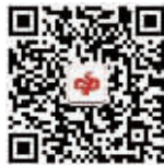
浙江福彩官方微信

6亿元派送首个大奖花落谁家? 大家拭目以待吧! 同时别忘了关注浙江福彩官方微信(扫码加关注), 9万元话费等等您抢。