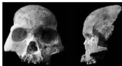
在蒙自发现的马鹿洞人头骨化石。