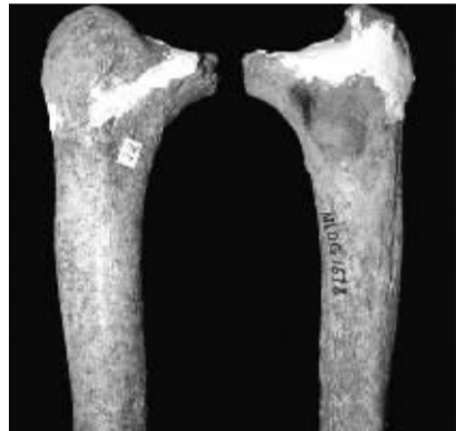
在蒙自发现的马鹿洞人股骨化石。