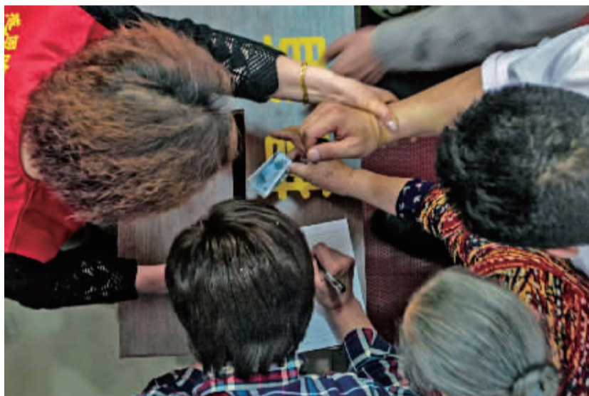
餐厅运营费用全部来自爱心人士的捐助。