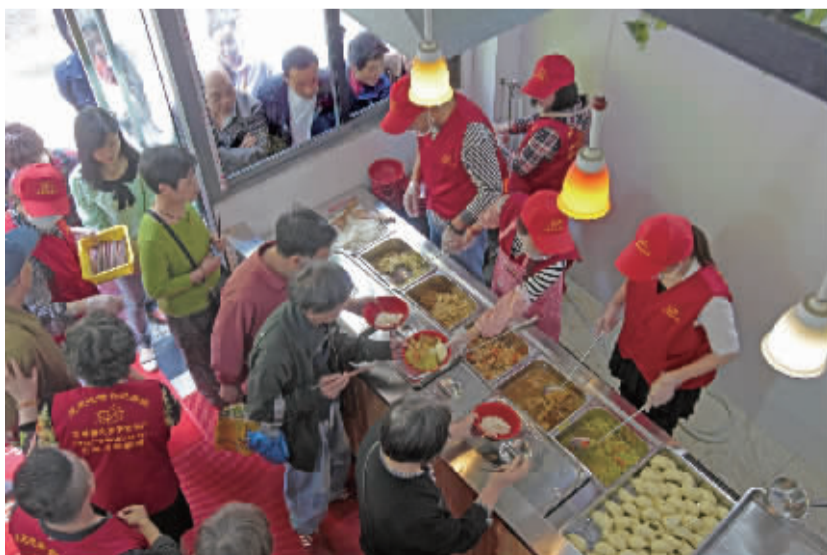
中午时分，餐厅迎来众多就餐人员，餐厅服务员都是义务服务。