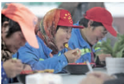
几位保洁员享受免费午餐。