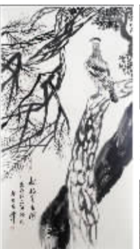
齐白石嫡传弟子汪艳君6平尺真迹《松柏高立图》,寓意:“松柏”暗含长寿之意。