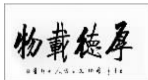
启功嫡传弟子金行8平尺真迹《厚德载物》,寓意:道德高尚的人能承担重大任务,是中华优良品德的诠释!