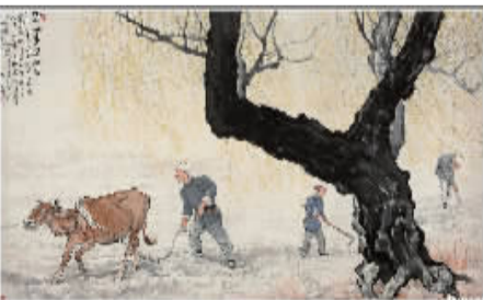
徐悲鸿嫡传弟子武岳6平尺真迹《九州无事乐耕耘》,悬挂家中,田园美景,感悟人生!悬挂办公室,自然美景,心旷神怡!