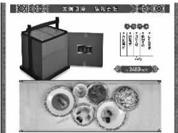
售价3480元的“龙腾四海套装”。

中，搭配丰富，除了经典的淮扬狮子头，其他菜品也分别属于全国各大知名菜系，例如，佛跳墙属于闽菜系，油焖大虾属于鲁菜，鲍鱼四宝属于粤菜系，银耳素烩属于北京菜，酸辣乌鱼蛋汤鲁菜、豫菜中都有。