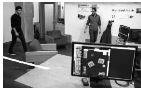
房间里两名研究人员被隔壁的设备识别后在显示器上显示为两个圆点。

美联社22日报道，在麻省理工学院迪娜·卡塔比教授的领导下，研究团队开发了一个设备，能够穿过墙体，利用无线电信号的变化识别墙壁另一端的人体轮廓，而后将信号显示在屏幕上，人们的活动即可被实时追踪。