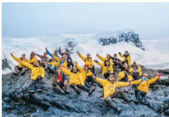
队员们在南极合影。

对全团队来说，这是一次真正的远行，也是终生难忘的一次经历。这一路，除了被纯美的大自然所震撼外，还近距离接触了从未见到过的动植物。但在岛上看动物时也要有纪律，离企鹅或其他动物至少5米远，不可以主动接近动物。面